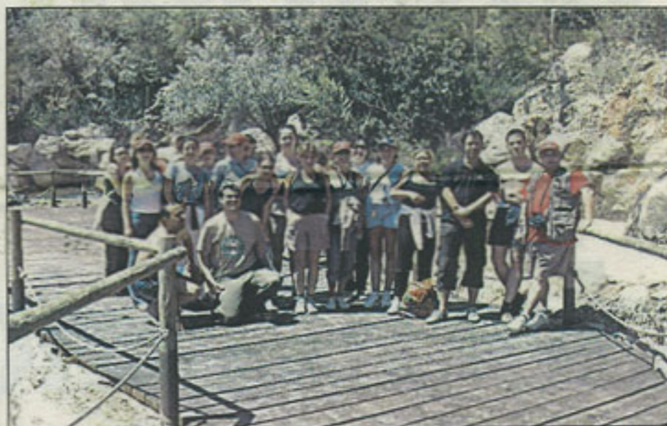
El grupo de agentes que participó en la excursión.