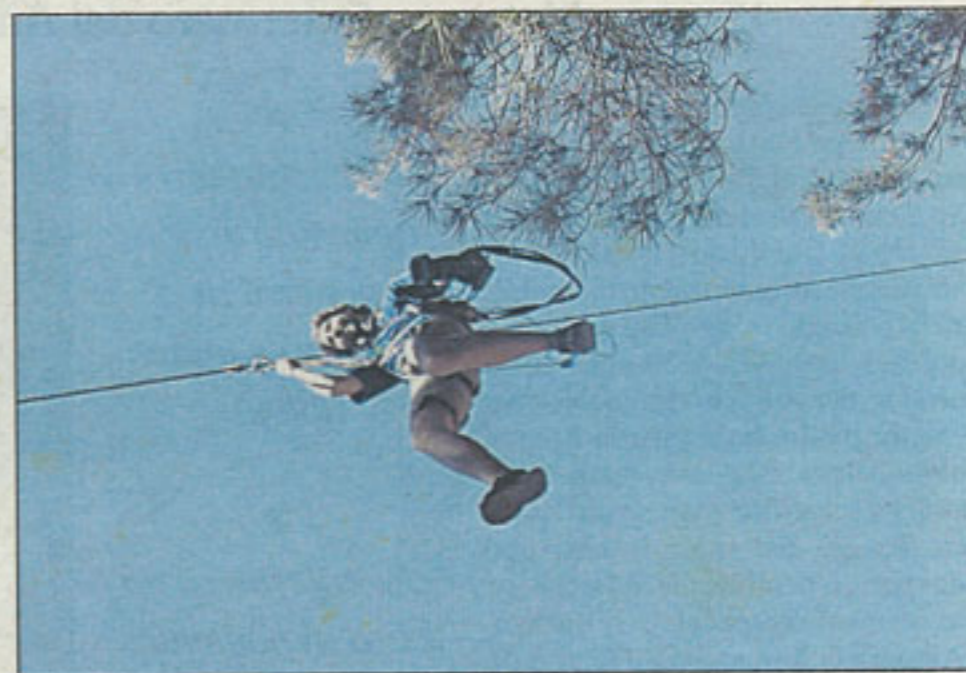
Una tirolina de 400 metros de longitud y puentes sobre el vacío pusieron a prueba el equilibrio.

El futuro hotel rural con 25 suites y un pequeño campo de golf se inaugurará en 2006